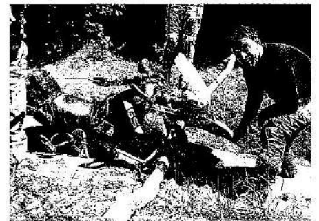
Die dicke Adventure versenkt. Nicht nur im Wasser, sondern noch schlimmer: im Schlamm

Bei meiner zweiten Teilnahme im August 2005 in Slatina-Timis bestätigen sich alle Erfahrungen nochmals. Mit der Reifemischung Mefo vorne und Romvelo hinten kämpft sich die G/S wackerer denn je durch schlammige Passagen. Die starken Regenfälle haben viele Wege aufgeweicht. Auf einer steilen Wiese gibt es kein Durchkommen mehr. Ferner zeigt sich, dass man alte Regeln ruhig beherzigen sollte. Die Reduzierung des Reifenluftdrucks auf 1,5 bar macht sich äußerst positiv auf Komfort und Traktion bemerkbar. Im Wettstreit mit zwei Honda XR 600 und einer KTM EXC 450 in einer vergleichsweise flotten Gruppe kommt es schließlich auf jedes Detail an.