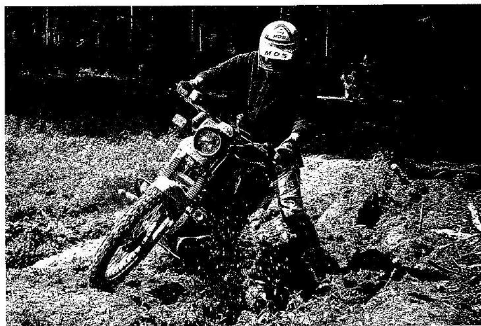
Zum Glück nur relativ selten: die G/S, kurz vorm unfreiwilligen Tieferlegen