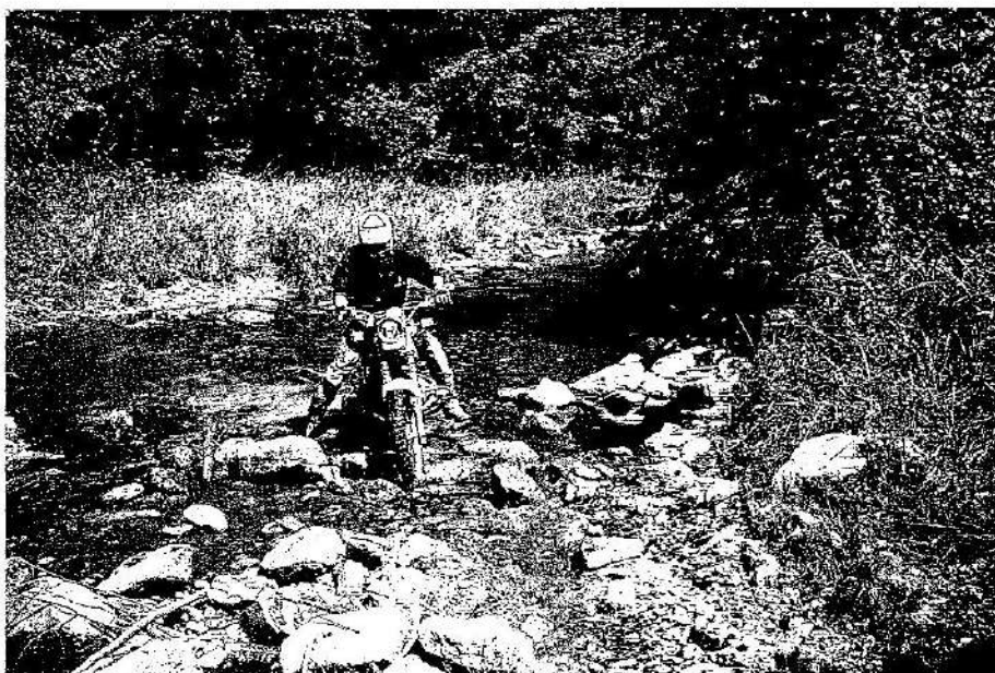
Auch wenn es vielleicht nicht immer so aussieht: Wasserdurchfahrten können richtig Spaß machen