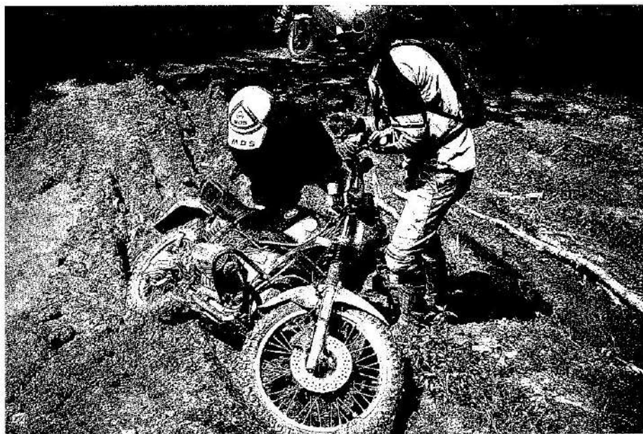
Solidarität unter den Teilnehmern: Gemeinsam hebt es sich besser, auch die Bandscheibe freut sich

dauert 45 Minuten, und danach ist klar, wieso es eine Regel der Enduromania ist, dass mindestens zu dritt gefahren wird. Alleine oder nur zu zweit hätte die Boxerbrumme wohl im Wald bleiben müssen.